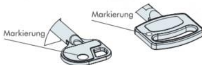
Abbildung 1 - Schlüsselmarkierung

Schlüssel so in das Schloss einführen, dass die Markierung auf der Schlüsselreide in Richtung des Schlossriegels zeigt. Das Schloss ist für rechts angeschlagene Türen ausgelegt (Drehachse rechts). Der Schlüssel muss zum Öffnen des Schlosses im Uhrzeigersinn gedreht werden. Versperrt wird das Schlüsselschloss in umgekehrter Drehrichtung.